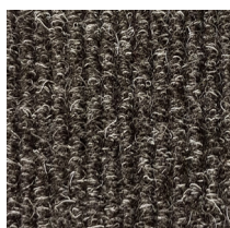
102 - Zwart