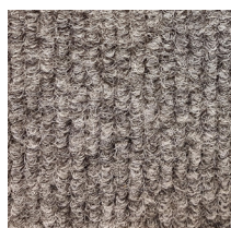
101 - Grijs