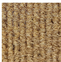
107 - Coco

Nota: De vermelde specificaties, omschrijvingen en illustraties zijn gebaseerd op de beschikbare informatie op het ogenblik dat deze publicatie gedrukt werd. Inkommaten en inkommatkaders met uitsnijdingen en/of onregelmatige vorm, prijzen en leveringstermijn steeds op aanvraag.