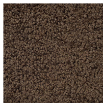
104 - Brun