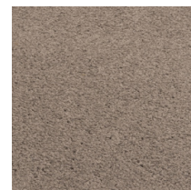
106 - Espresso