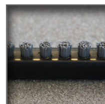
GS - Gris