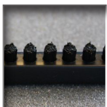
ZT - Noir