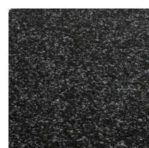
102 - Noir