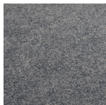
101 - Gris