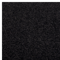
102 - Noir