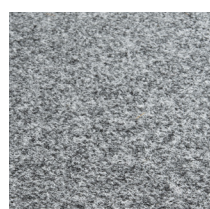
101 - Gris